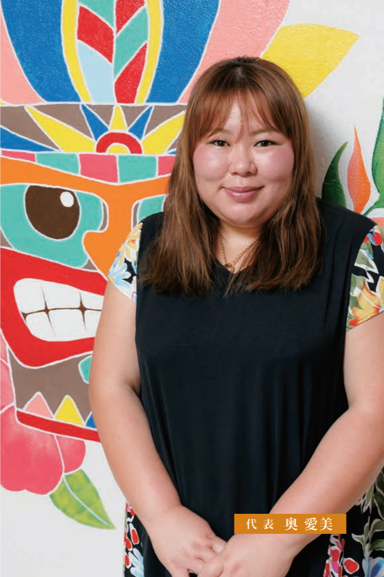
代表 奥 愛美

令和5年度宜野湾市特産品推奨認定 「島豆腐ビーツ克蘭ベリーベーグル」 県民フードと言われる、島豆腐をパンの原材料として使用し 身体に優しい無添加の島豆腐パン