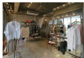
voyage 代表 比嘉 瑞希

voyage 住 所: 宜野湾市喜友名 1-31-1 (101) TEL: 098-988-8273