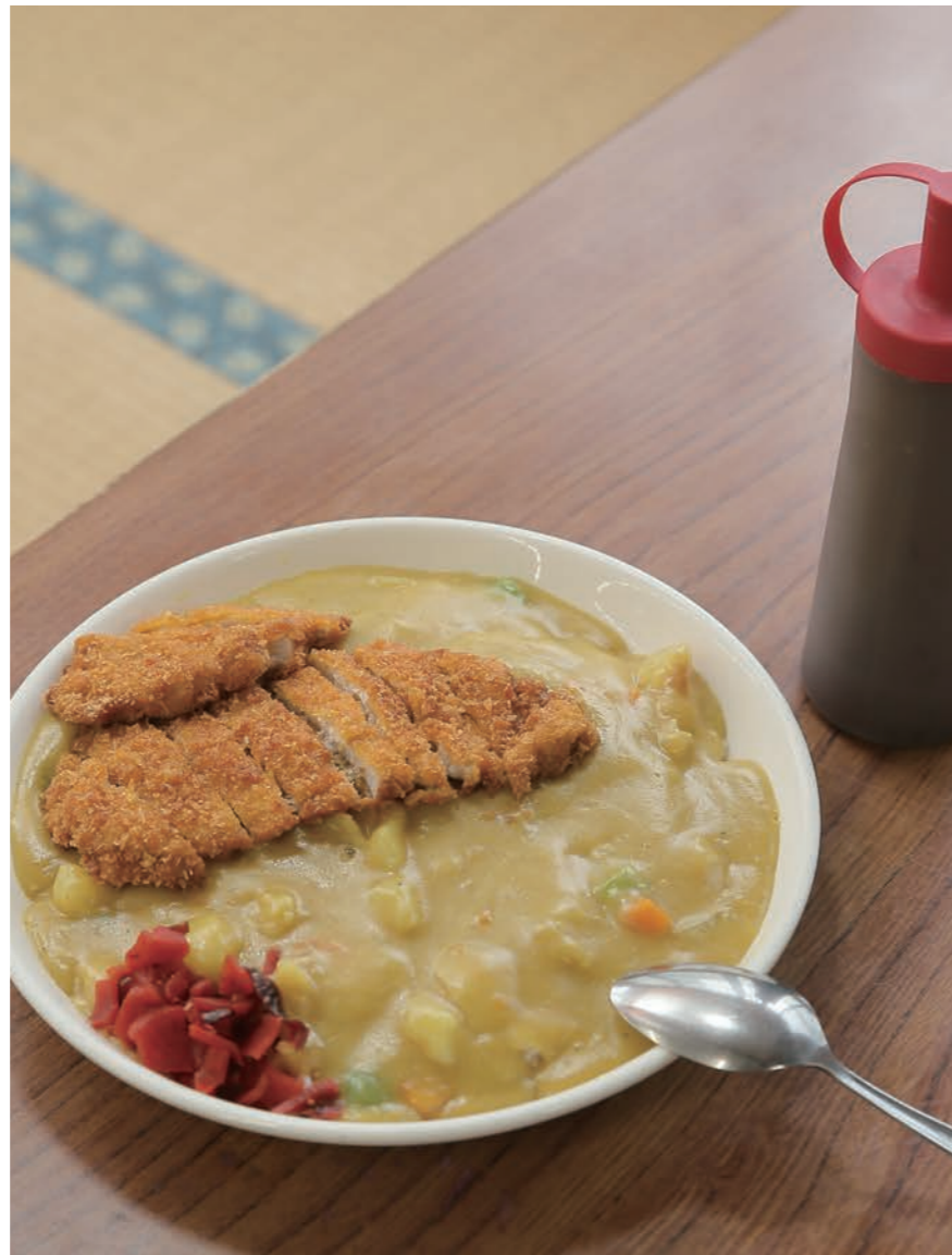
地元の方々に愛され、懐かしさも感じさせてくれる昔ながらの黄色いカツカレー。

昔から通って下さっているお客さんが自分のお子さんを連れて来店してくれるのは何とも感情深く、お客さんの歴史と一緒に店も成長できている気がして、とても嬉しいです。