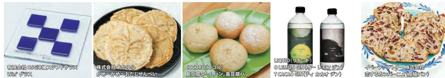
【令和3年度に認定された特産品推奨品】

商工会では、宜野湾市の特産品を推奨し、製造業者の生産技術と生産意欲の向上、販路の拡大を推進することを目的に下記のとおり、令和4年度宜野湾市特産品推奨品の募集は8月から行う予定です。