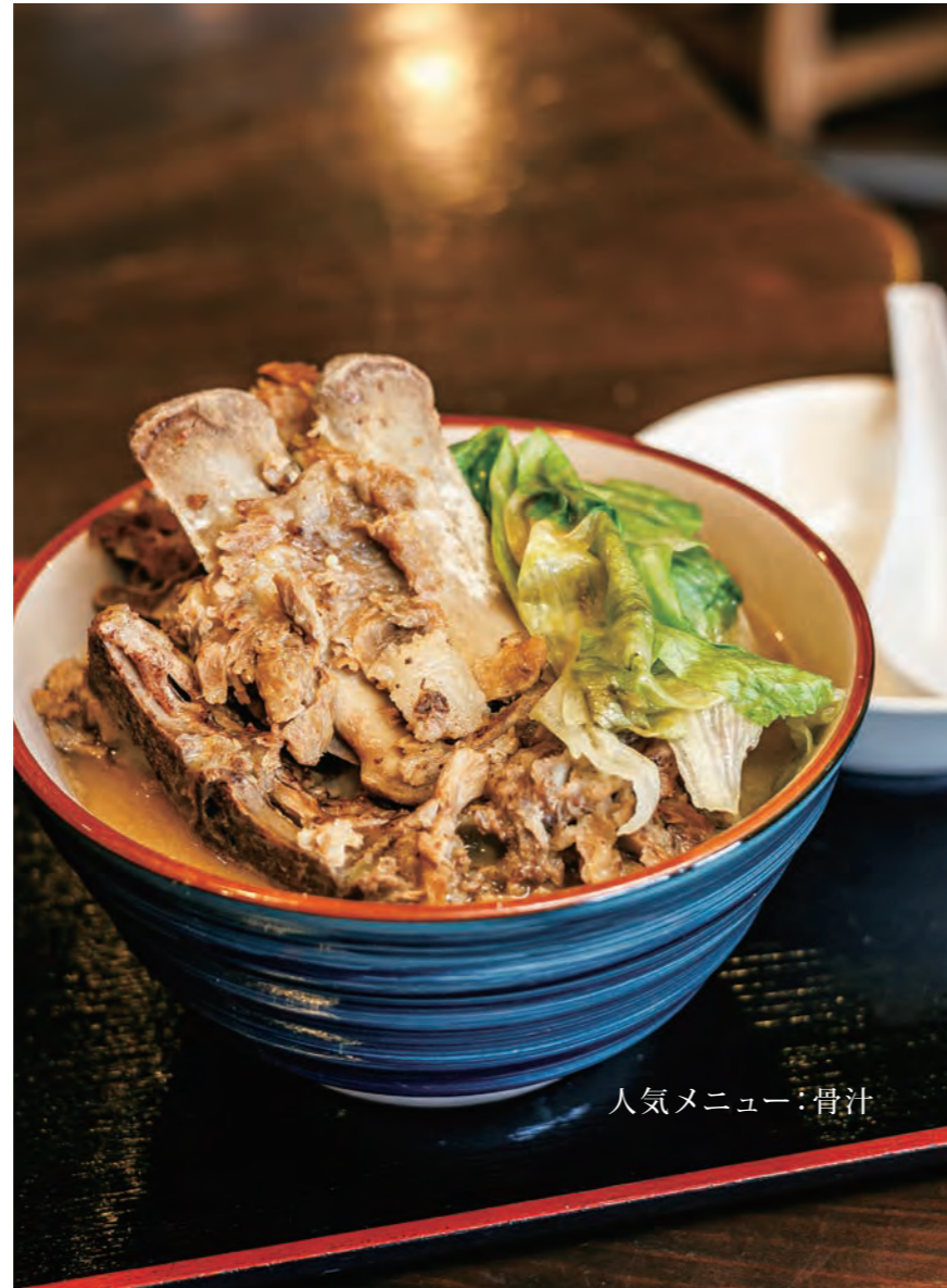
人気メニュー:骨汁

近年は、自炊離れの方が多くいらっしゃいますが、味噌を使った料理をご自宅でも楽しんで頂きたいです。地元で造られた味噌を使用して、ぜひご家庭でも味噌汁や骨汁に挑戦してみてください。