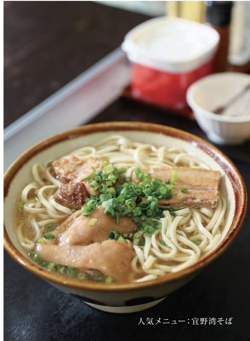
人気メニュー：宜野湾そば

県外の物産展にも力を入れております。これからも全国各地へ沖縄そばの美味しさを伝えていきたいと思っております。皆様のご来店を心よりお待ちしておりますので、お気軽にお越しください。