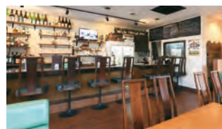
ワインと日本酒 炭火烧 kitchen TARO

住所: 宜野湾市野嵩 1-3-2 電話: 098-927-6215 営業時間: 17:00 ~ 24:00 定休日: 年中無休